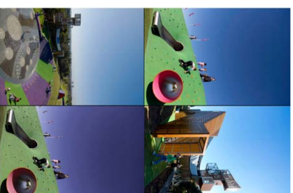
IMAGEN OBJETIVO 3