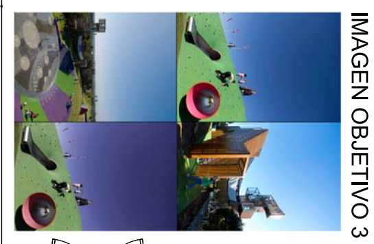
IMAGEN OBJETIVO 3