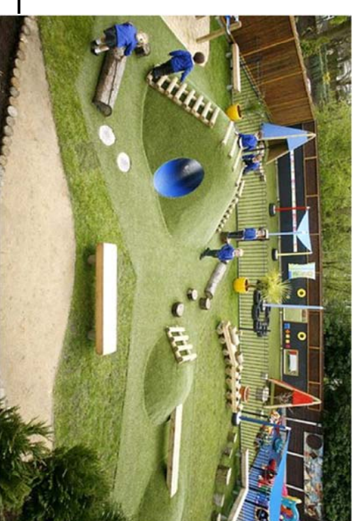
IMAGEN OBJETIVO 1