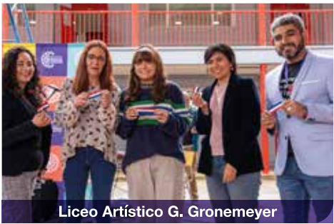
Liceo Artístico G. Gronemeyer