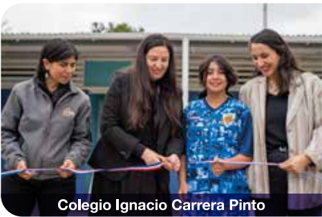
Colegio Ignacio Carrera Pinto