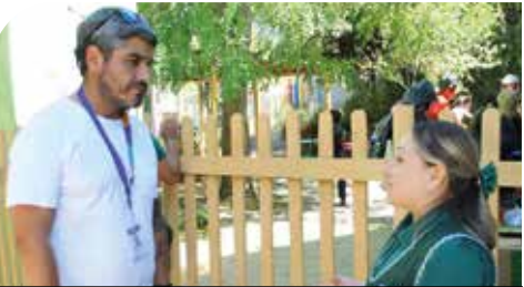
Secretario General de CMQ conversando con una de las educadoras del Jardín Aylén