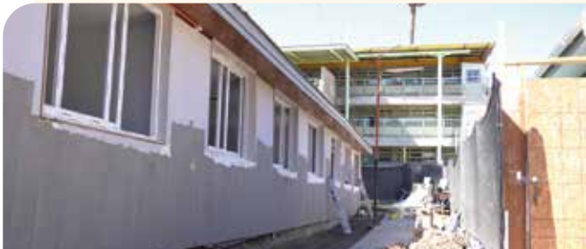
Avanzan obras en Liceo Comercial