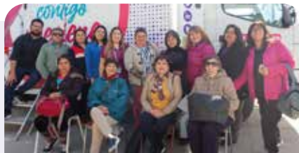
Programa Mamografías para vecinas de Colliguay