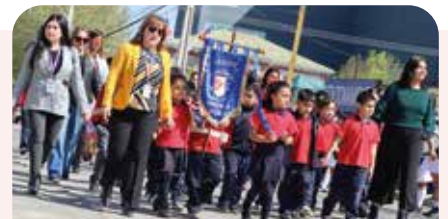
Desfile Cívico Estudiantil Colegios y Jardín CMQ