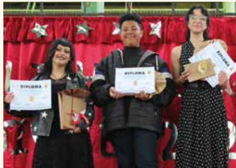
Exitoso Primer Encuentro Interescolar de canto en inglés de Quilpué