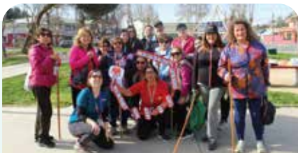
Participativa caminata por el Mes del Corazón